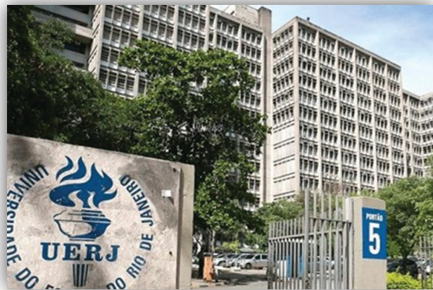
Figura 1 - UERJ Maracanã

A cada ano, a UERJ amplia sua infraestrutura em pesquisa, com a instalação de novos laboratórios, a assinatura de convênios técnico-científicos nacionais e internacionais, a criação de grupos de pesquisa e o incremento dos programas de apoio. O resultado é o aumento da produção científica da Universidade e de sua contribuição para o desenvolvimento da iniciativa privada e do setor público.