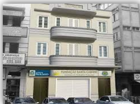
Figura 2 - Fundação Santa Cabrini

Criada em 1977, a Fundação Santa Cabrini (FSC) é órgão da administração indireta do Estado do Rio de Janeiro vinculada à Secretaria de Estado de Administração Prisional (SEAP), e desenvolve suas ações com vistas à garantia do direito à remuneração, ressocialização e remição de pena através da ocupação laboral e da qualificação profissional. Sua existência tem sido essencial para a garantia do acesso ao trabalho, ao emprego e à renda a pessoas que