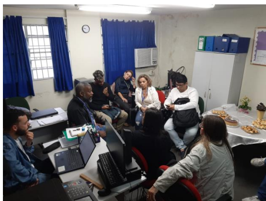
Figura 3 – Visita ao CQPRO

As visitas tiveram como principal objetivo aproximar a secretaria do IFHT, que realiza toda a parte de certificação dos alunos dos cursos, com a secretaria dos cursos, para melhorar esse fluxo de informação e a certificação seja emitida com maior rapidez.