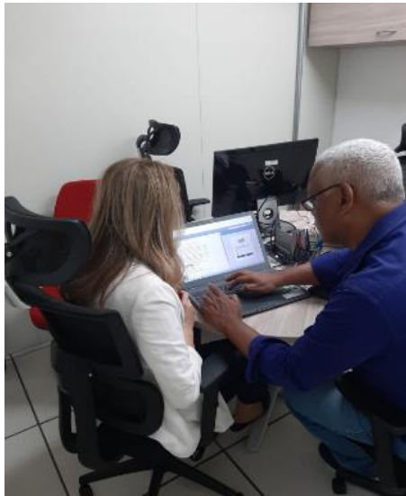
Figura 5 – Reuniões de alinhamento