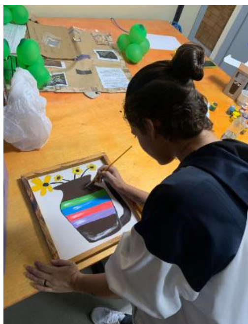
Figura 11 – Atividades desenvolvidas pelos professores no CQPRO

Vale lembrar que foram desenvolvidas também, ao longo desse trimestre, outras atividades educativas, como horta comunitária, desenho e pintura, visando cada vez mais à inclusão desses jovens e adultos o retorno ao mundo do trabalho com uma qualificação melhor.