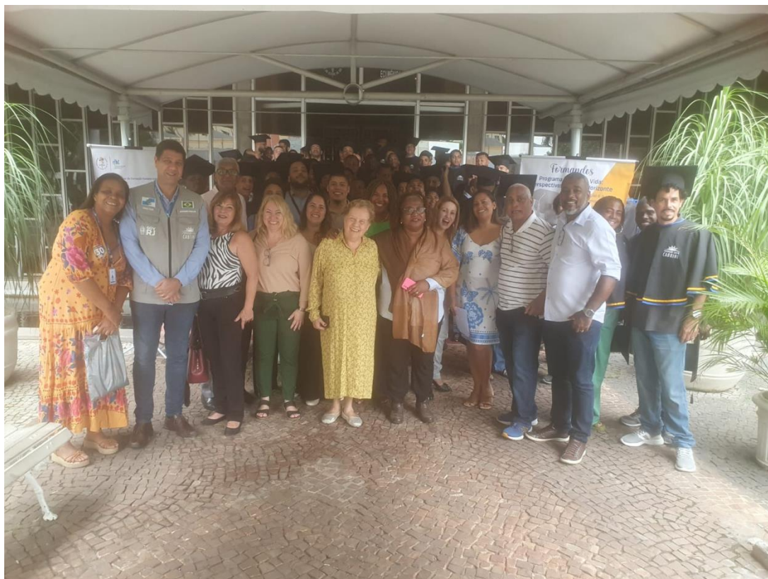
Figura 7 – Formatura da 4ª turma dos cursos de qualificação

No dia 01 de novembro, aconteceu na Capela Ecumênica da UERJ, mais uma formatura dos alunos dos cursos de capacitação profissional, onde tivemos a participação de autoridades, professores e colaboradores, assim como de muito familiares e amigos dos formandos que demonstravam imensa satisfação e orgulho de poder estar presenciando a mudança na vida dessas pessoas.