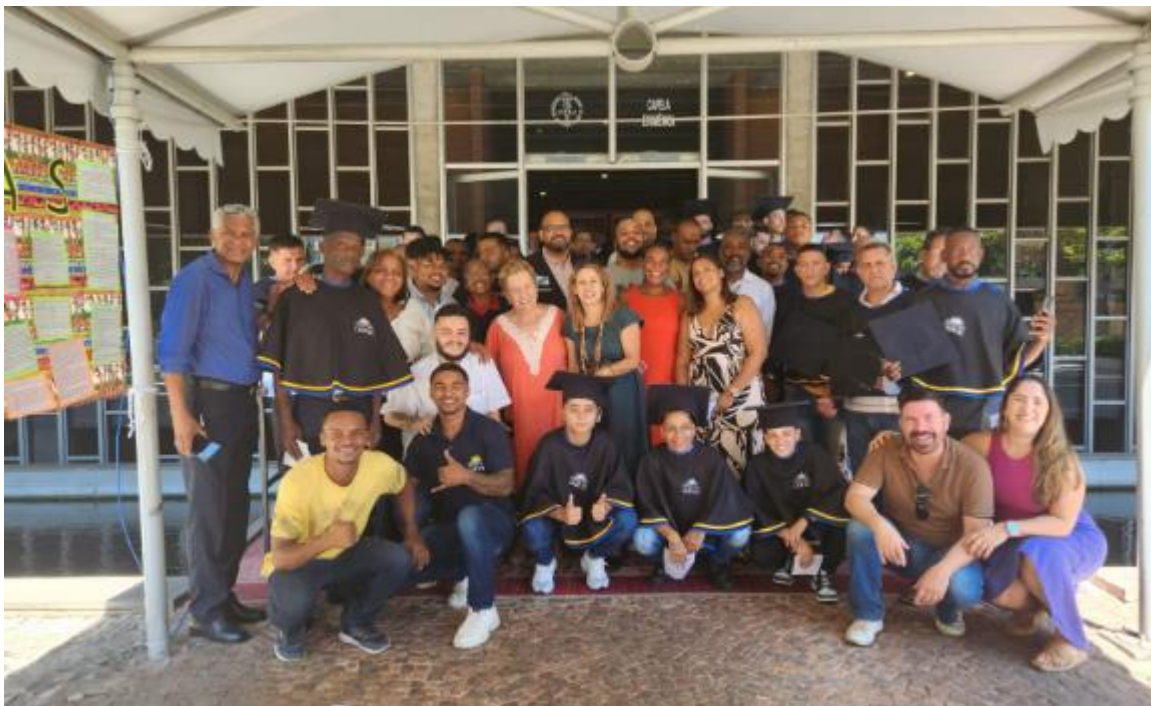
Figura 13 – Formatura da 5ª turma do CQPRO

Na sexta feira dia 15 de dezembro, ainda como parte do seminário, realizamos a formatura da 5ª turma dos cursos de qualificação do CQPRO, assim como o lançamento do E-book “Falando Sobre Educação, Saúde e Direitos para Privados de Liberdade”, com a presença de autores que escreveram os artigos publicados no livro. Também foi lançada e distribuída a cartilha intitulada “Informações sobre a Visitação às Pessoas Privadas de Liberdade”, lembrando que essa cartilha também está disponível em formato digital.