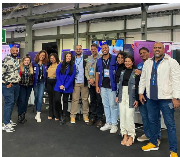
Figura 4 – Fundação Santa Cabrini na RIW

Do dia 03 ao dia 06 de outubro, aconteceu no Píer Mauá, na cidade do Rio de Janeiro, a edição do Rio Innovation Week (RIW), onde a Fundação Santa Cabrini apresentou as suas atividades, entre elas o Programa Mudar de Vida – perspectivas além do horizonte.