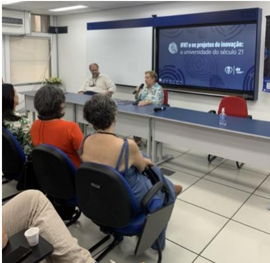
Figura 12 – Abertura do Seminário

No final do trimestre o IFHT organizou um seminário “IFHT e os projetos de inovação: a universidade do século 21”, onde tivemos na abertura, no dia 12 de dezembro uma apresentação das atividades realizadas pelo Programa Muda de Vida.